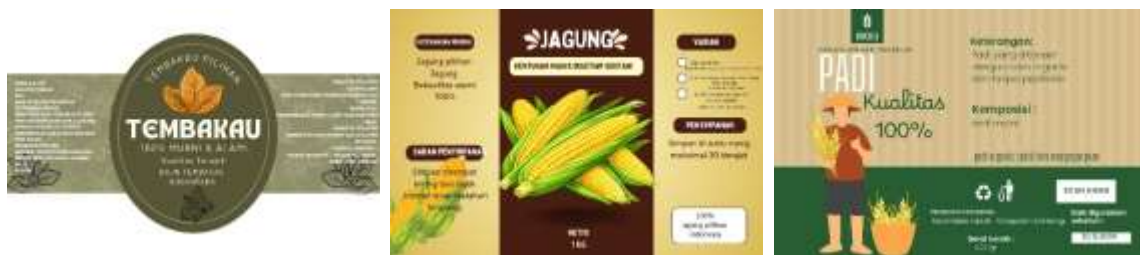
Gambar 2. Dokumentasi Visual Branding Komoditas Hasil Bumi Karya Murid SMPN 3 Kabuh

Sebagai bukti nyata implementasi pilar kompetensi inti pada poin 3 di dalam skema Gambar 1, data dokumentasi karya murid memperlihatkan keberhasilan mereka dalam merancang prototipe identitas visual produk (branding). Kemampuan praktis ini meliputi pembuatan logo kreatif, desain kemasan produk berbasis kearifan lokal, serta slogan pemasaran yang menarik. Berdasarkan portofolio karya pada Gambar 2, murid mampu menciptakan desain kemasan yang menonjolkan estetika lokal digabungkan dengan tren visual modern yang diminati pasar saat ini, seperti pada label produk komoditas tembakau, jagung, dan padi: