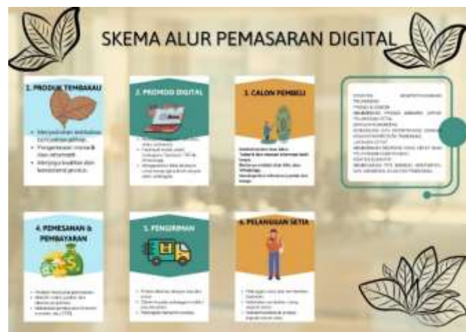
Gambar 3. Infografis Skema Alur Pemasaran Digital Hasil Pertanian Karya Murid SMPN 3 Kabuh

Selain pembuatan branding visual pada Gambar 2, tingkat literasi digital murid juga terefleksi dari kemampuan mereka memetakan ekosistem niaga secara runtut. Murid secara berkelompok mampu menyusun infografis mandiri yang menguraikan rantai pasok pemasaran digital dari hulu ke hilir sebagaimana disajikan pada Gambar 3: